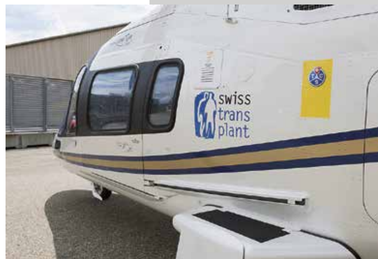
Sur demande de Swisstransplant, l'A109E HB-ZVG de l'Alpine Air Ambulance, pilotable en régime IFR (vol aux instruments), est parfois utilisé pour des transports d'organes.

En fonction de la situation, une série de préparatifs sont nécessaires: un transport en ambulance à travers le tunnel du Saint-Gothard doit, dans la mesure du possible, être signalé à l'avance à la police pour que le trafic puisse être bloqué dans un sens. Autre exemple, un jet doit pouvoir être garé dans un hangar chauffé à Genève, car en pleine nuit, personne n'est disponible pour assurer le dégivrage. Et même pour une ambulance transportant un cœur, l'accès aux aéroports n'est pas toujours garanti à des heures avancées. Pendant que ces mises au point sont effectuées, le jeudi matin, l'hélicoptère jaune EC135P1 HB-ZJE est préparé pour l'intervention et sa non-disponibilité pour d'autres trajets est signalée à la centrale d'appels d'urgence. On monte des sièges pour les médecins à la