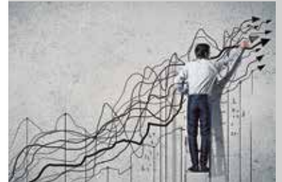
Une augmentation du don d'organes est nécessaire.

L'objectif de la mise en œuvre de ces points est de faire augmenter le nombre de donneurs effectifs par rapport au nombre de donneurs potentiels. D'après les résultats de l'étude SwissPOD (Swiss Monitoring of Potential Donors), ce dernier est trois fois supérieur au nombre de dons enregistré. Les facteurs à l'origine de cette disparité seraient notamment des inégalités sur le plan de l'organisation et de la sensibilisation du personnel au sein des hôpitaux à la tâche d'identifier un donneur potentiel.