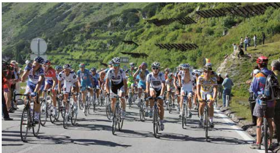
Swisstransplant participe pour la 5 ième fois au Tour de Suisse.

Pour la cinquième fois, Swisstransplant sera un des fournisseurs officiels de la course, qu'elle accompagnera avec un véhicule du tour à son logo. Accompagner le Tour de Suisse est pour Swisstransplant l'occasion, pendant neuf jours, de sensibiliser le public au don d'organes, le Tour de Suisse devenant ainsi également un tour de l'information. kr