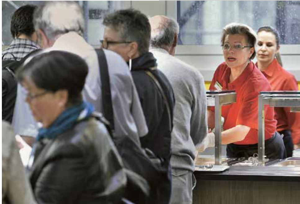
Un dîner délicieux à la clinique de pédiatrie de l'Hôpital de l'Île.

La MBM est fondée sur le principe selon lequel l'esprit, l'âme et le corps interagissent en permanence en tant qu'entités inséparables. L'hypnose thérapeutique, la méditation ou le Tai Chi sont des méthodes reconnues pour activer le potentiel d'auto-régénération des individus. Cependant, il recommande un entretien préalable avec le médecin traitant avant de recourir à tous les autres types de mé-