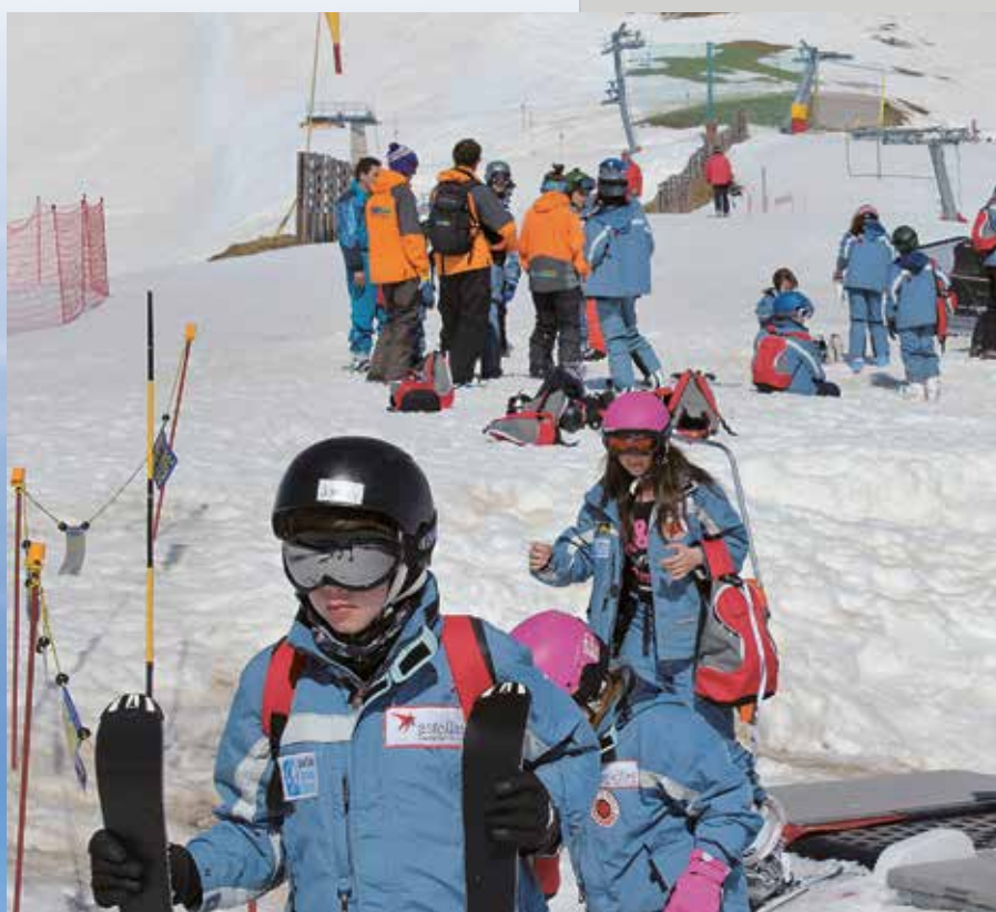
Combi de ski bleue, sac à dos rouge, le signe de reconnaissance des enfants-TACKERS.