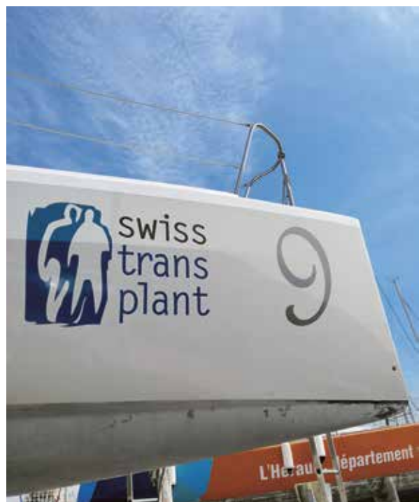
... et attire l'attention sur le don d'organes.