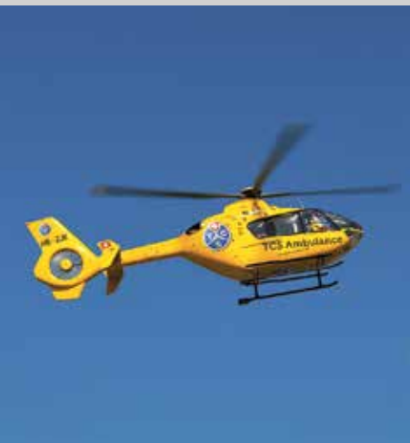
L'Eurocopter EC135P1 HB-ZJE est l'un des trois hélicoptères de l'Alpine Air Ambulance servant dans le cadre de transports d'organes, en plus des jets et des ambulances au sol.

Le timing est décisif, d'autant plus que le patient est déjà au bloc opératoire. Les moindres retards doivent être signalés afin de garantir un déroulement sans heurts. Pour les pilotes, les transports d'organes ne présentent pas de difficultés particulières sur le plan technique tant que le temps est clément. C'est la complexité de l'organisation qui requiert une rigueur accrue. Environ 80 pour cent des transports se font de nuit. Pour la centrale d'intervention, cela consti-